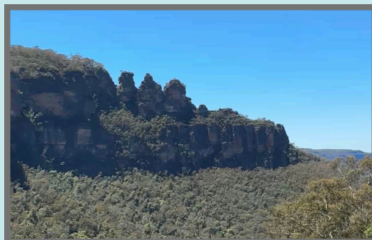
#ブルー・マウンテンズ国立公園 ブルー・マウンテンズ国立公園は、シドニー近郊に位置する世界自然遺産で、広大な砂岩の断崖や深い渓谷、ウェントワースの滝など壮大な景観が広がっています。太古の植物「ウォレミマツ」を含む固有種の宝庫でもあり、青い山並みやジャミソン渓谷、ジェノラン洞窟など、多様な自然の魅力に溢れています。