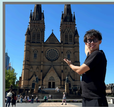
#シドニー・セント・メアリー大聖堂 オーストラリア産の砂岩を使った建物で大迫力でした。