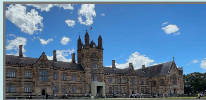
#シドニー大学 シドニー大学はオーストラリア最古かつ最大級の大学などだけあって、建物の迫力がすごいです！複数のキャンパスがあり歴史的な建物と近代的な施設が調和しています。一度訪れたらここで学びたい！と思わせること間違いなしです。