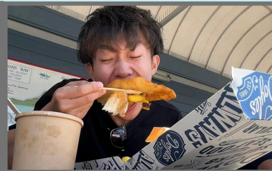
#シドニーでの食事 100%オーストラリア産の食材でできたビーフバーガー、ジューシーなお肉にボリュームも満点で大満足でした！ボンダイビーチの人気店のフィッシュ&チップス、このオーストラリア産の魚は初めて食べました！皮がサクサクで身はふっくら、とても美味しかったです。

☆☆「空飛ぶカンガルー」のカンタス航空で行ってきました！ シドニーへはカンタス航空の直行便で快適に！☆☆