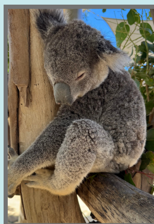
#シドニー動物園 コアラの可愛い写真も撮れて、旅行の思い出がたくさん残りました！