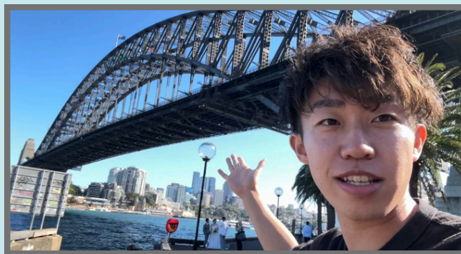
#ミルソズポイント オペラハウスとハーバーブリッジを一望できる超人気スポット！