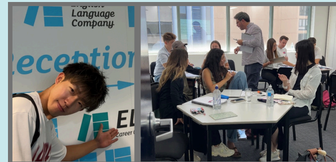
#語学学校ELC English Language Company (ELC) は、都心でアクセスが超便利です。多国籍な学生が集まり、英語を学ぶだけでなく、海外の文化や人と出会うという意味でも価値ある場所であり、多数のカリキュラムが用意されていて一人一人にあった学習プログラムで通えるのも魅力です。