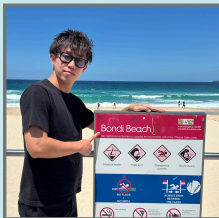
#ボンダイビーチ 「ボンダイ＝砂の丘」というだけあって、海の青さと白い砂浜のコントラストが綺麗です。