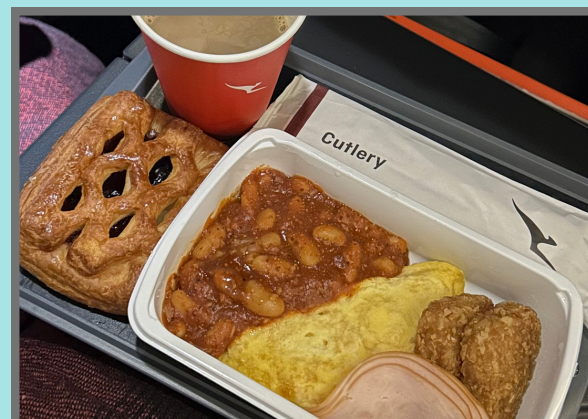
#カンタス航空機内食 機内食は2回でした。その他にもドリンクやスナックが用意されていて、料理の質が高く、どれも毎回美味しかったです。1回の食事は量もしっかりあってお腹も心も大満足でした！

2025年12月15日から2026年3月28日まで、 札幌(新千歳)ーシドニー直行便を週3便で運航予定です*。