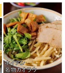
ホイアン 名物カウラウ