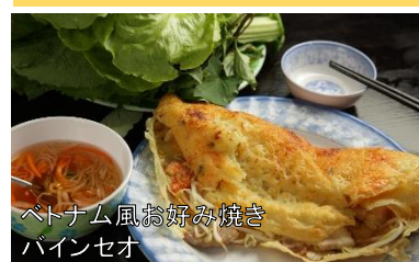
ベトナム風お好み焼き バインセオ