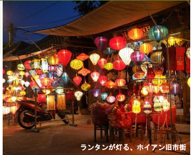
ランタンが灯る、ホイアン旧市街

古い街並みが残る古都ホイアン。16世紀には朱印船貿易により移住した日本人街がありました。夜になれば色鮮やかなランタン街を彩り、旧市街はより華やかな雰囲気のにぎわいます。