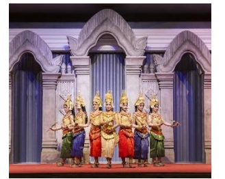
クメール伝統舞踊アブサラダンス