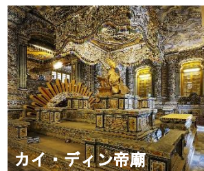
カイ・ディン帝廟